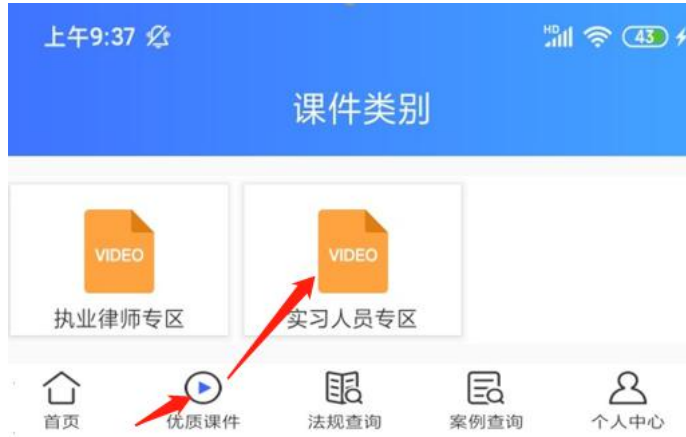
手机 APP 显示界面

2、个人中心可以查看自己的学分，打印凭证（仅电脑网页版支持）；历史记录里详细记录了最近观看过的视频。