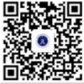
安卓版下载二维码

2、关注并进入“河南律师之家”微信公众号，点击左下角在线教育选择菜单中在线培训即可。用户名和密码与手机端 APP、网页版河南律师之家互通使用。安卓、苹果 ios 用户均可登录。